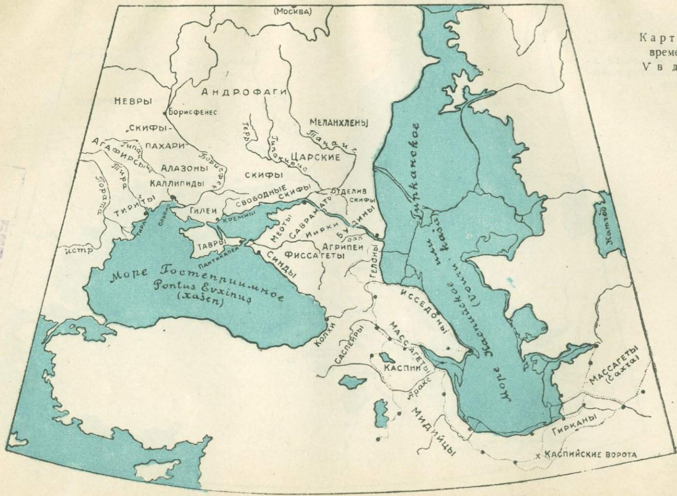
Карта Кавказа времен Геродота V в до нашей эры

ВИДИМОСТИ Геологического Института Академии Наук СССР